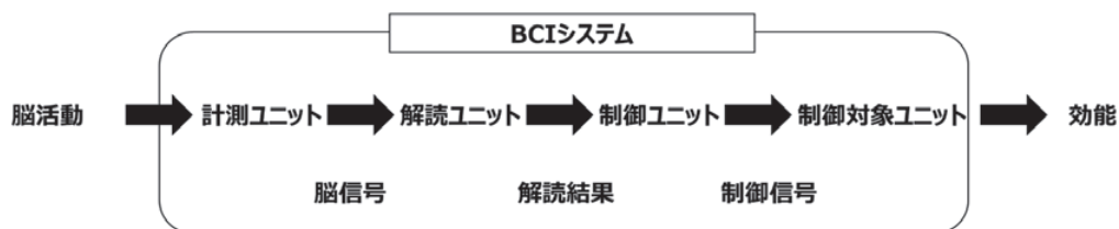
図1. BCI システムの構成

なお、本評価指標の対象に含まれない脳深部刺激装置（Deep Brain Stimulation、以下「DBS」という。）や応答性神経刺激装置（Responsive Neurostimulation System、以下「RNS」という。）等の疾患の治療を目的とした神経刺激治療機器、非植込み型 BCI 及び入力型 BCI（脳への情報の入力）等の評価において本評価指標の適用が可能な場合、その適用を妨げるものではない。また、BCI は身体機能の一部を補完、回復又は強化する技術であるが、身体機能の強化（軍事利用等も含む）を意図した技術に関しては倫理的な課題もあるため対象とはせず、患者に対して標準的な機能を補完又は回復する技術に対象を限定する。